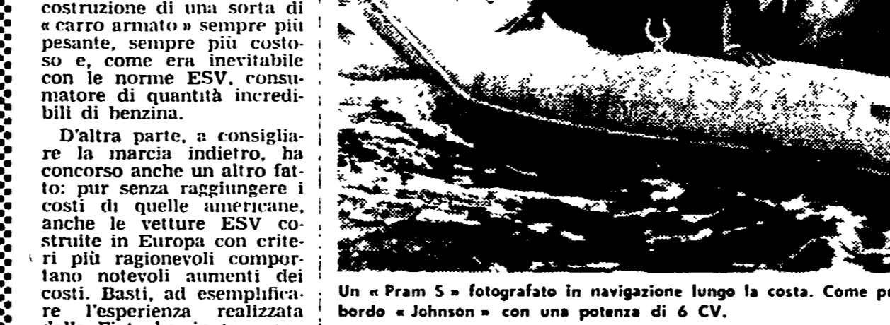
Un « Pram S » fotografato in navigazione lungo la costa. Come propulsore è stato adottato un fuoribordo « Johnson » con una potenza di 6 CV.