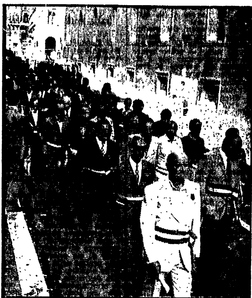
Alcuni gonfaloni dei Comuni che hanno partecipato alla manifestazione di ieri. A destra: la testa del corteo dei sindaci

Comuni e Province del Lazio hanno fatto sentire ieri in piazza SS. Apostoli la loro ferma protesta unitaria contro le errate linee del governo in materia di politica economica e finanziaria, che stanno soffocando tutto il sistema delle autonomie locali, nella regione e nel Paese.