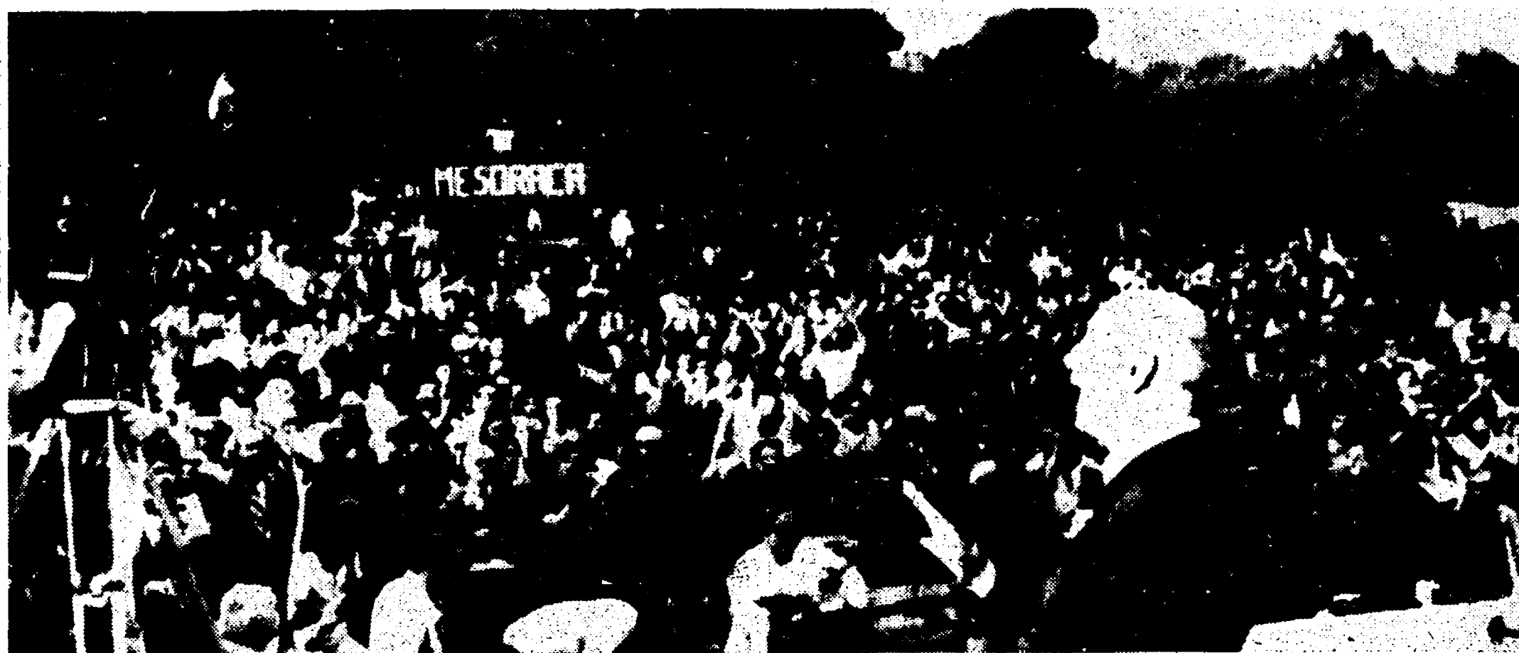
BARI — Un momento del grande corteo tenuto dal compagno Gian Carlo Pajetta alla manifestazione conclusiva del Festival d'apertura della campagna per la stampa comunista.

Ma il successo di questo Festival rappresenta per noi un aspetto qualcosa di nuovo: per tanti giorni, e a contatto diretto con tanta gente, abbiamo dimostrate che cosa è oggi e che cosa vuole essere sempre di più il nostro Partito anche in queste regioni. Ci siamo presentati con la forza, con le capacità organizzative, con il volto del Partito nuovo, di una organizzazione moderna, al servizio della lotta per la rinascita del Mezzogiorno, al servizio della democrazia, al servizio del movimento operaio, che sa adeguarsi allo svolgersi e al crescere della società; che sa annunciare l'arricchimento permanente, avanzare proposte, indicare soluzioni, e accogliere le forze per renderle reali.