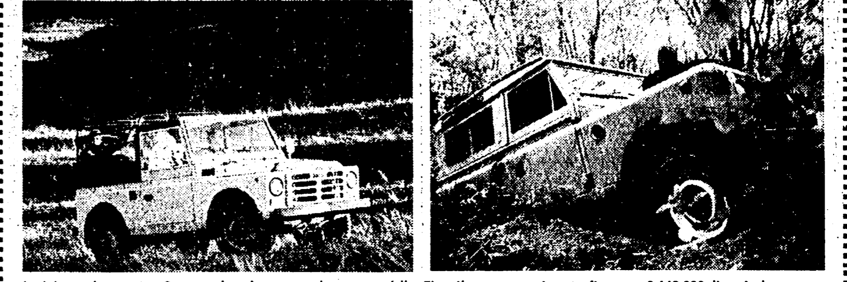
A sinistra: la nuova «Campagnola» immessa sul mercato dalla Fiat. Il suo prezzo è stato fissato a 3.640.000 lire. A destra: una «Land Rover» fotografata mentre affronta un percorso particolarmente impegnativo.

Le «4x4» in circolazione in Italia sono oltre 30 mila - Una nuova formula del Land Rover Club per rendere meno costose le gare fuoristrada