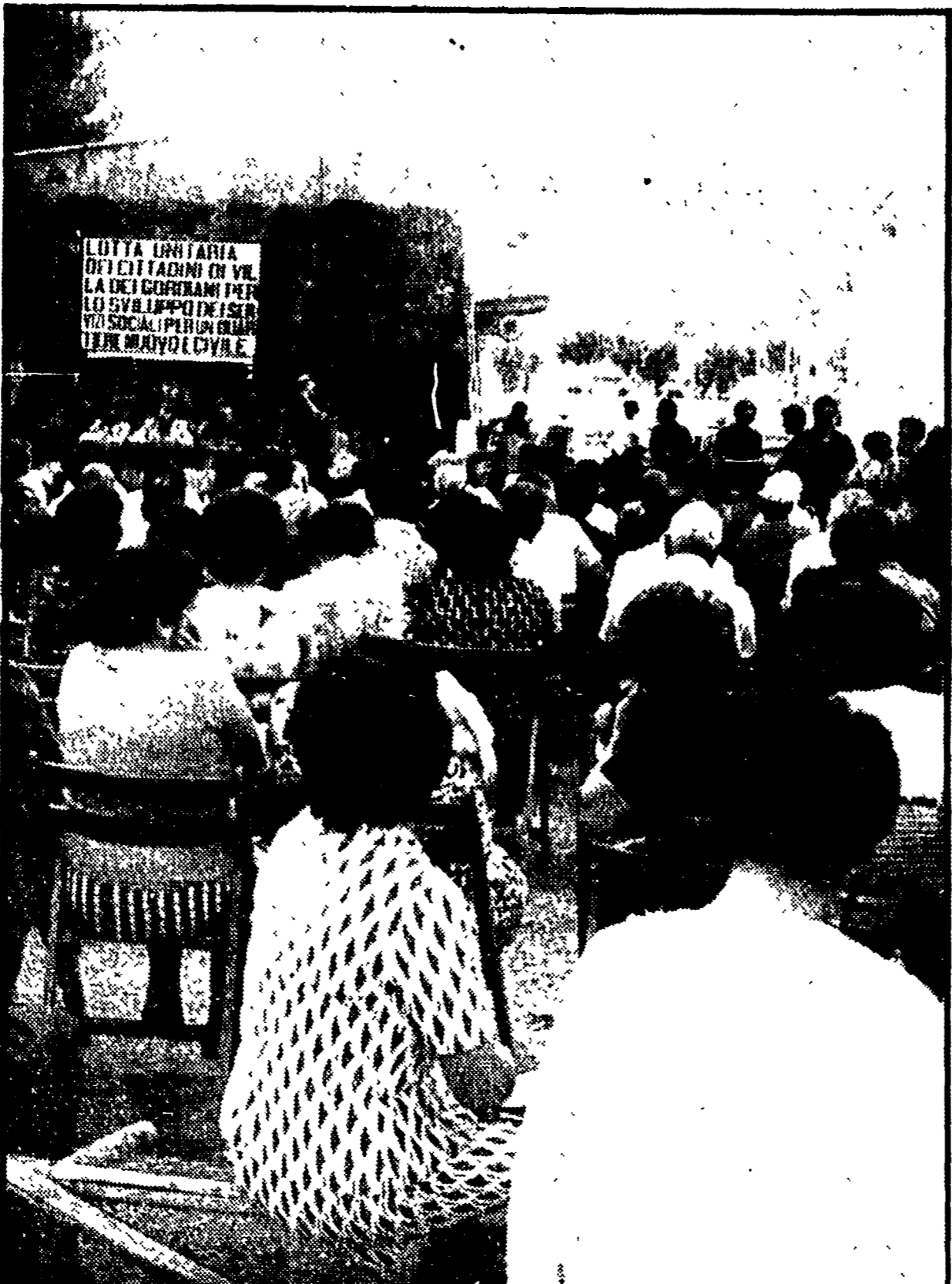
ASSEMBLEA PER I SERVIZI A VILLA GORDIANI Si è svolta ieri presso il largo Terme Gordiane una assemblea popolare dei cittadini di Villa Gordiani sui problemi della zona...