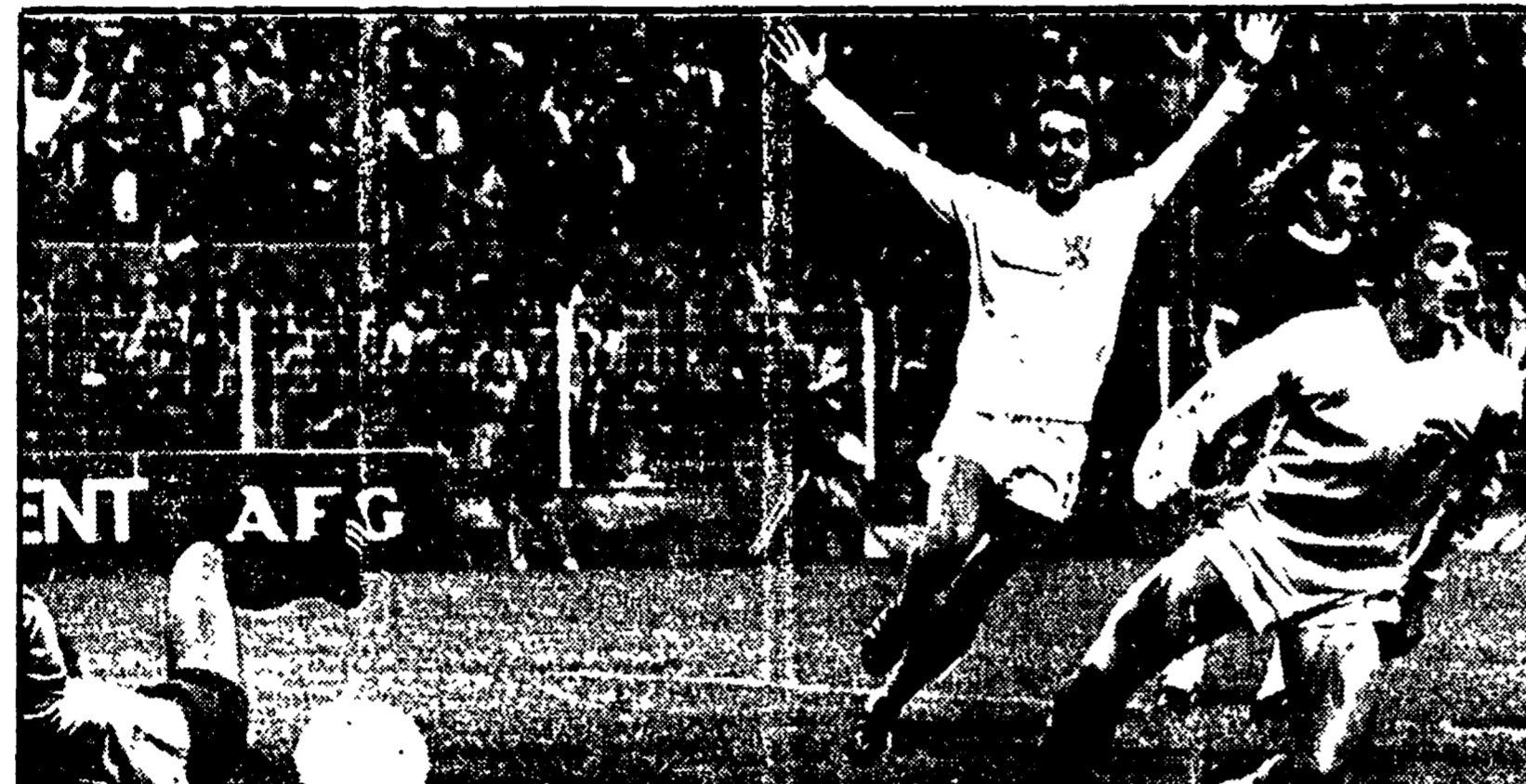
Rep esulta dopo il secondo gol segnato dall'Olanda ai Brasiliani, che le è valsa l'ammissione alla finalissima della Coppa del mondo

MONACO, 4. Cinque ore di interminabile autostrada da Francoforte via Norimberga e siamo qui, a Monaco, per la «due giorni» mondiale. La grande macchina dell'organizzazione perfetta nel suo insieme si inceppa talvolta nei dettagli ma, ormai, tutto sembra pronto. E la città inverte il verso: l'attesa è poche partecipazioni perfino ossessiva. La caccia ai biglietti è diventata spietata, il loro prezzo astronomico. Autentiche folle in nome del calcio e della Germania di Schoen.