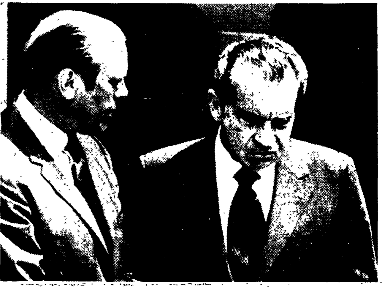
WASHINGTON - Il Presidente Nixon - assieme al suo vice Gerald Ford (nella foto) - si trova a San Clemente dove sta trascorrendo un periodo di vacanza. Egli sta meditando sul futuro dopo la condanna del suo ex consigliere Ehrlichman e la presentazione della relazione sul caso Watergate...

Per gli investimenti e l'occupazione Ferrovieri ed edili preparano gli scioperi Oggi ferma la Calabria per quattro ore - Domani riunione del direttivo della Federazione CGIL, CISL e UIL