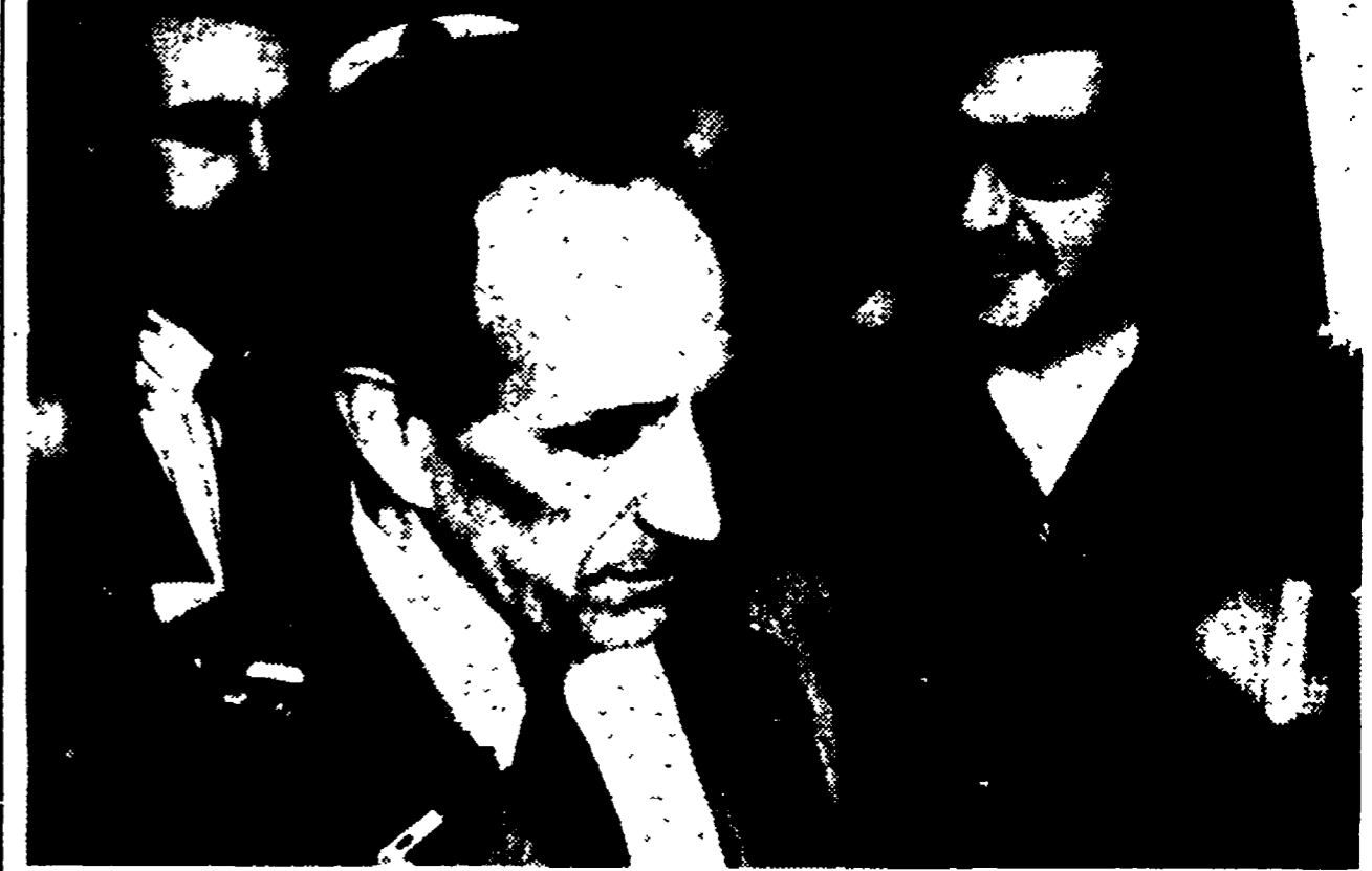
LISBONA - Il nuovo Primo ministro Goncalves attorniato dai giornalisti.