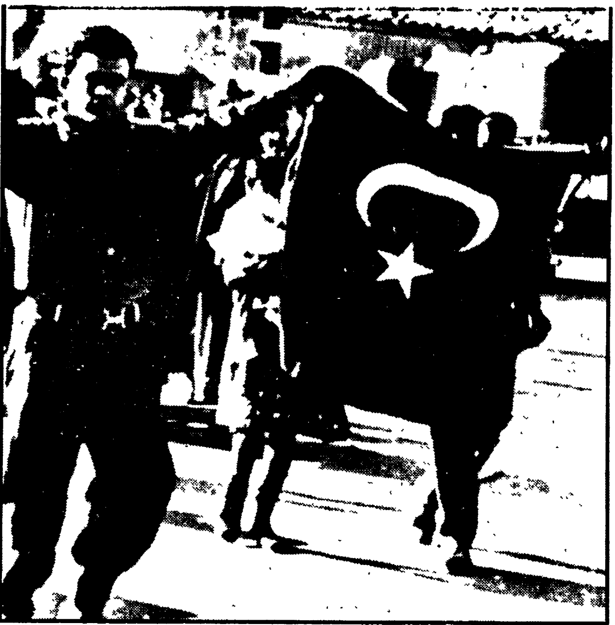
NICOSIA - L'autoproclamatosi presidente di Cipro dopo il colpo di stato di ieri, Nicola Sampson, è qui ritratto (a sinistra), pistola in pugno, mentre agita una bandiera turca conquistata in un assalto

Il drammatico appello lanciato dalle forze rimaste fedeli a Makarios