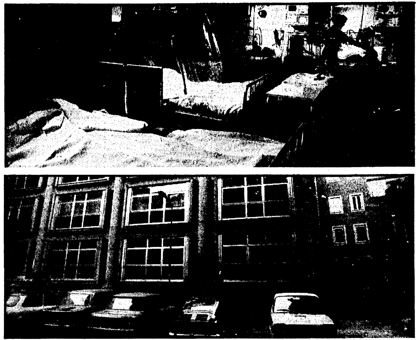
Stretti in pochi metri i degenzi del reparto rianimazione dell'ospedale S. Giacomo che avrebbero invece bisogno, per essere curati adeguatamente, di molto spazio. SOTTO: Il moderno reparto di ortopedia, ultimato da due anni ma inutilizzato

Denuncia di medici e lavoratori - Vasti locali inutilizzati - Attrezzature perfette usate solo a metà - Tredici medici si alternano ogni giorno in una sola stanza per le visite ambulatoriali - Urgente la programmazione regionale