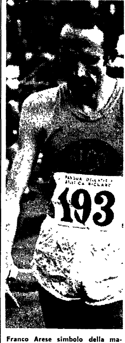
Franco Arese simbolo della malata atletica italiana.

me oggi, sono in fase ospedaliera. Sono, cioè, più morti che vivi e non è detto che tutti quelli che Formia ha annunciato, saranno al via. Ma è mai possibile che quando si dice UISP si pronuncino un nome che senta la bestemmia?