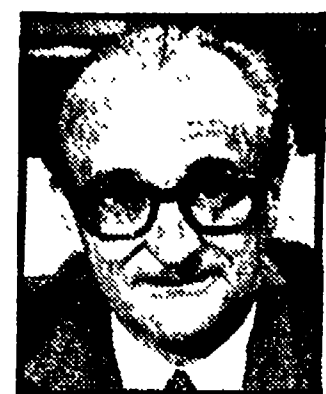
NATTA - Necessità di modifiche sostanziali