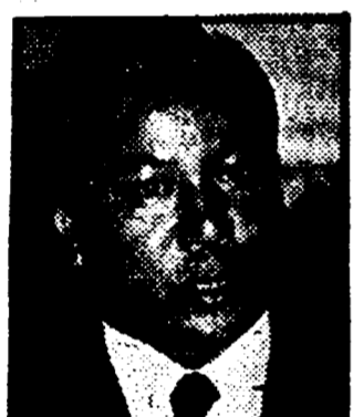
THIEU - L'esecutore della «dottrina»