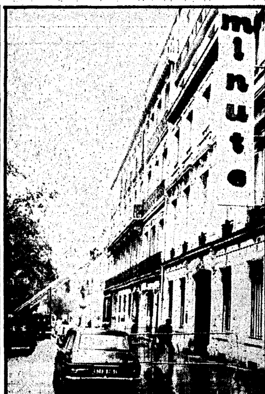
Esplorazioni a Parigi