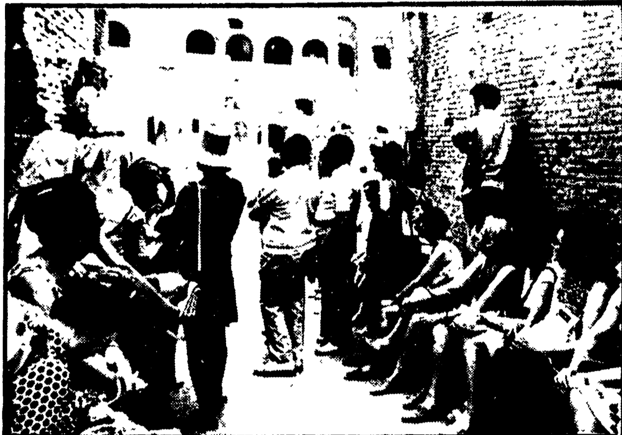
Gruppi di turisti in visita al Colosseo

TEMPERATURE E PREVISIONI DEL TEMPO. — Abbiamo detto, le temperature registrate, sono alte in molte città. Il 15 agosto le città più calde d'Italia sono state Bolzano e Roma, tutte e tre con 35 gradi. Ieri il primato è stato di Roma e Firenze (37 gradi). A Bolzano la temperatura era di 36 gradi, a Napoli e Milano di 35 gradi. Le previsioni dell'Aeronautica prevedono cielo sereno su tutte le regioni italiane, temperatura senza variazioni apprezzabili, ma calmi quasi ovunque. SPIAGGE — Il «tutto esaurito», che ha tentato ad arrivare, è ormai giunto negli ultimissimi giorni per molte località balneari. Un po' dappertutto la nota dolente è: «mancano le spiagge». Nel caso più grave, addirittura «divieto di balneazione» (vedi Cinque Terre, S. Lucia e Mergellina a Napoli).