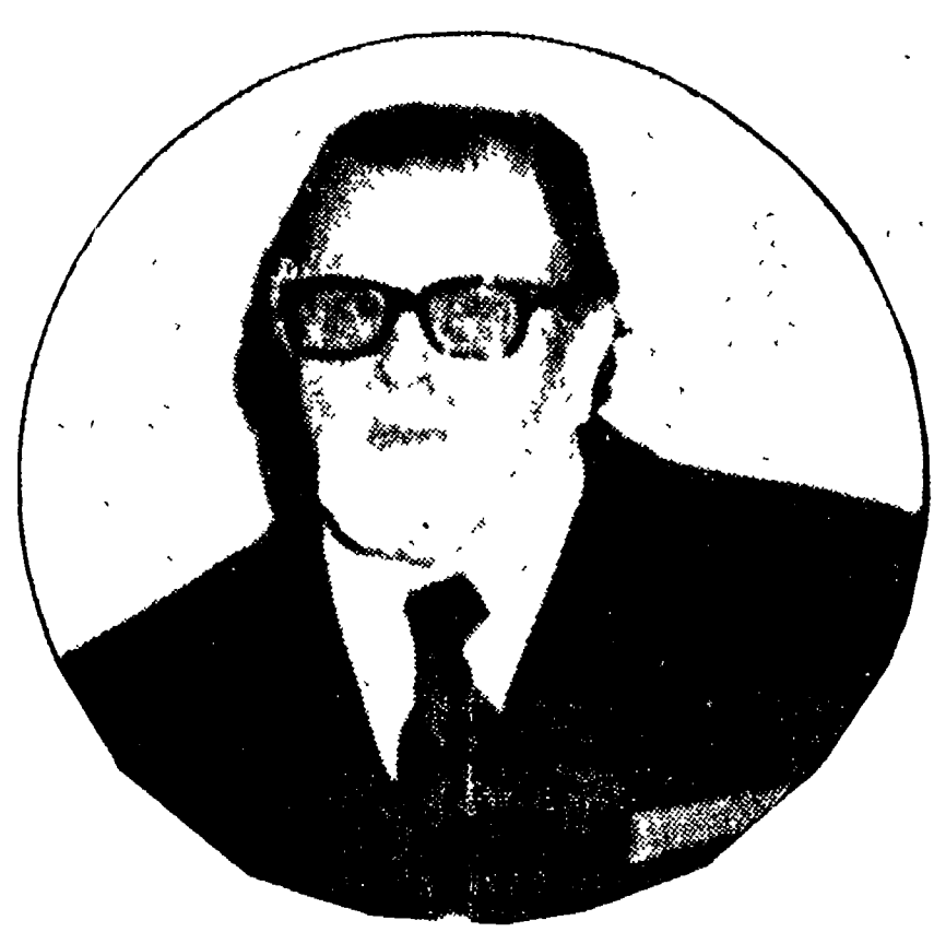
Una recente immagine di Frank Coppola