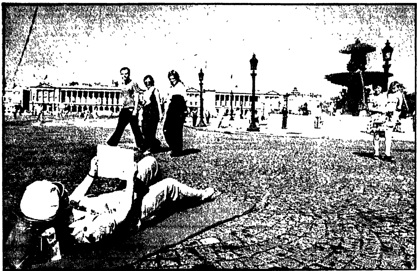
PARIGI — Turisti in Piazza della Concordia durante l'esperimento «isola pedonale» tentato dalle autorità cittadine

In Austria le presenze sono diminuite del 40% - Spiagge deserte in Portogallo - Il fallimento della Court Line - Sensibile diminuzione dei turisti americani - Crollo del flusso turistico in Spagna