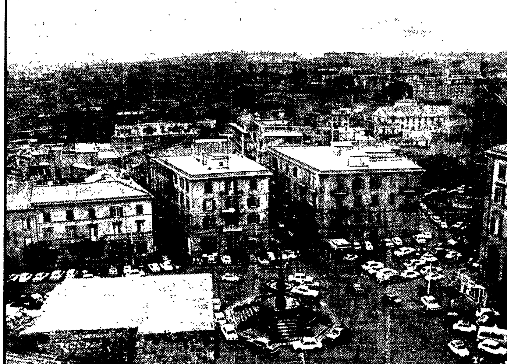
Una veduta panoramica di Viterbo vista dall'alto della piazza centrale.

Il movimento demografico delle forze di lavoro nella provincia di Viterbo dimostra con chiarezza lo spopolamento e la diminuzione del potenziale produttivo dell'intera zona.