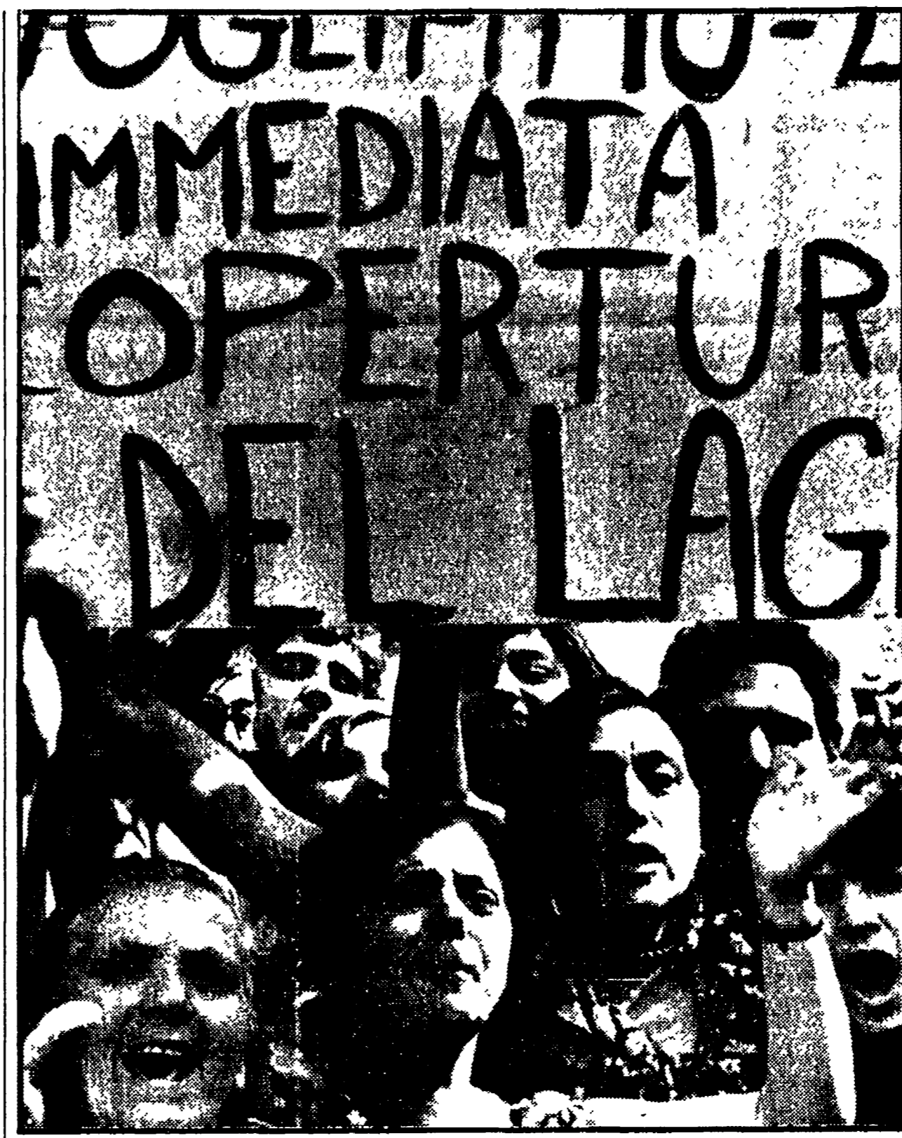
NAPOLI - Una dimostrazione di donne di Barra e Ponticelli del settembre dell'anno scorso. Nel cartello si chiede la copertura di un fumiocattolone pieno di rifiuti che scorre per i due rioni