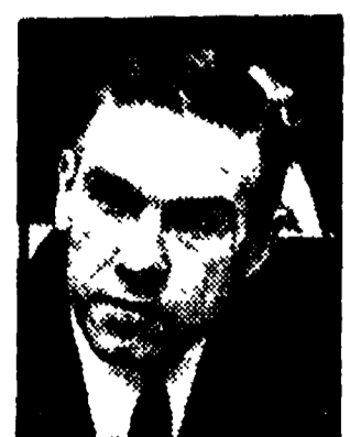
TRENTIN — Andare al cuore dell'unità sindacale