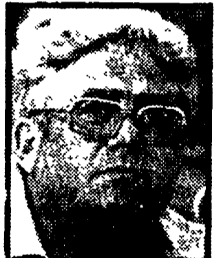
DIDO' — Una linea autonoma di politica salariale