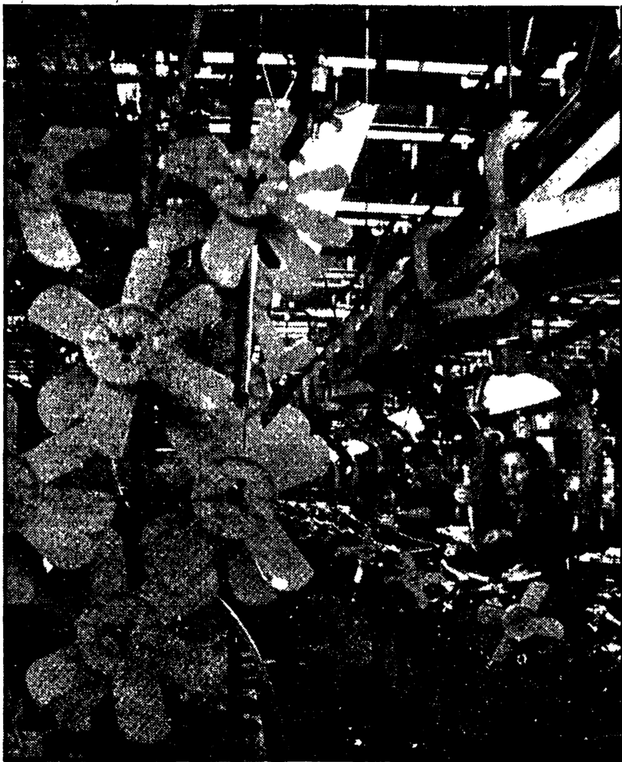
Il lavoro ad una catena di montaggio alla FIAT

« Certo, Caro Gucci, hai ragione tu, e la gente se ne accorge. Ai festival dell'Unità, a Roma, a Venezia, a Milano, a Bologna in cento e cento paesi, vanno ormai tutti, siano o no membri del Partito... »