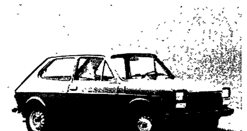
Vista esterna della «127» Special.

Immutata la linea e la meccanica della berlina che ha alle spalle quattro anni di successi - Le innovazioni riguardano la carrozzeria, gli allestimenti interni e gli accessori di serie