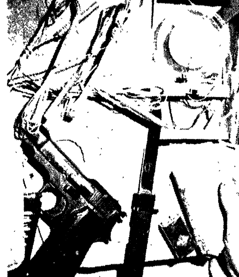
GENOVA - Il congegno ad orologeria trovato nell'appartamento dove è avvenuta, venerdì notte, la deflagrazione.