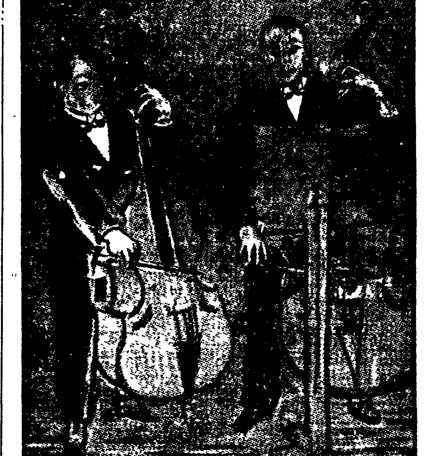
Dufy per i bambini

Per i tipi di Garzanti è uscito un nuovo volumetto della collana vallardiana «L'arte per i bambini».