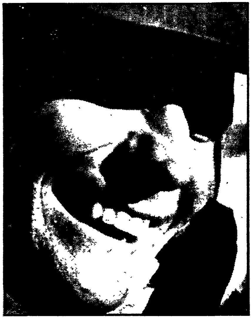
FITTIPALDI è l'immagine della felicità dopo la conquista del « mondiale »

Non ci sembra il caso di drammatizzare. Il dramma vero è stato quello del ventiduenne austriaco Helmut Koinigg, dilaniato orribilmente dal guard-rail di Glen. Certo non ci si aspettava un crollo così clamoroso della Ferrari proprio nella corsa al premio del Canada, questo non lo possiamo dubitare dal guard-rail di Glen. Certo non ci si aspettava un crollo così clamoroso della Ferrari proprio nella corsa al premio del Canada, questo non lo possiamo dubitare dal guard-rail di Glen.