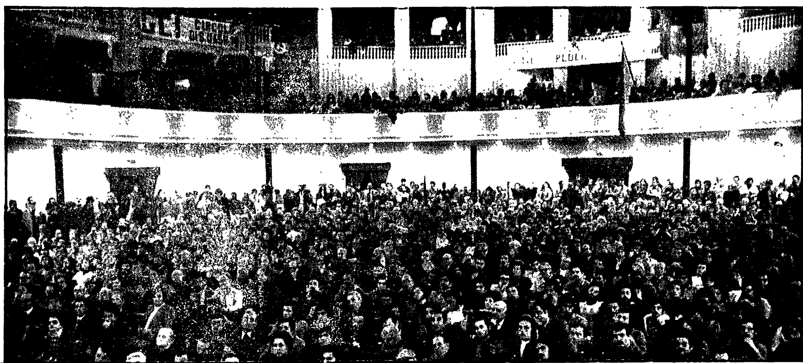
La folla che ha gremito domenica il cinema Adriano durante la manifestazione promossa dal PCI contro lo scioglimento del Consiglio comunale e per un governo serio che affronti i problemi del Paese

Denunciate le manovre dilatorie della DC e del PSDI che lasciano insoluti i gravi e urgenti problemi della città - L'opposizione comunista alla soluzione commissariale e allo scioglimento del consiglio comunale - Il 5 novembre, in concomitanza della visita di Kissinger, grande manifestazione popolare in Piazza del Popolo per la piena autonomia e indipendenza dell'Italia