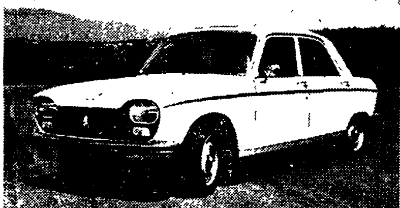
La berlina «204» Peugeot ora è disponibile anche con motore Diesel. Il suo prezzo (IVA compresa) è stato fissato in 2 milioni 595.000 lire.