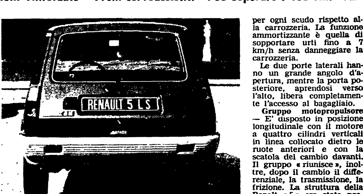
La Renault «5 LS» si riconosce facilmente dagli altri due modelli perché monta di serie, come già la Renault «16 TX», il tergicristallo-lavavetro sul lunotto posteriore. Il suo funzionamento è assicurato da un pulsante sulla sinistra della plancia portastrumenti.

una maggiore sicurezza di guida (fari allo jodio, diffusori per il disappannamento dei vetri laterali, tergicristallo-lavavetro sul lunotto posteriore, tanto per citarne alcune), possiamo ricavare una prima indicazione di quanto il rapporto peso/potenza (il propulsore eroga una potenza massima di 65 CV a 5500 giri ed assicura una coppia massima di 9,6 kgm a 3500 giri) molto favorevole per una guida più sportiva e per una maggiore durata dei gruppi meccanici.