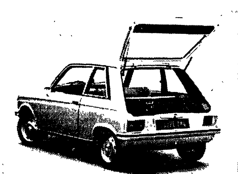
Il nuovo coupé Peugeot «104» fotografato con il portellone posteriore aperto. Nella foto in alto il cruscotto della vettura che è simile a quello della berlina nella versione «104 GL».