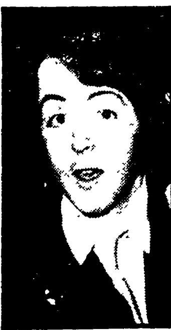
Paul Mc Cartney