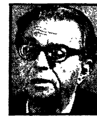
LA MALFA - « Anche senza il PSDI »