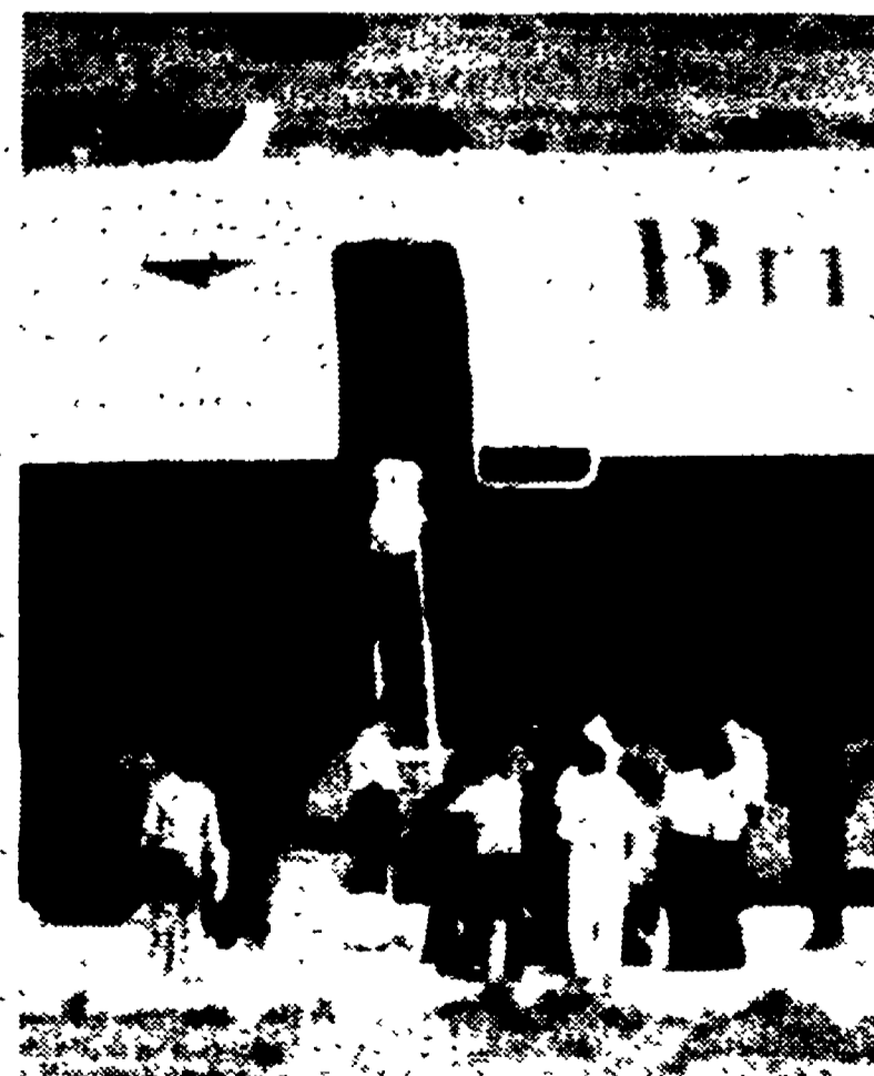
TUNISI — Gli ultimi passeggeri liberati abbandonano l'aereo sequestrato dai terroristi.