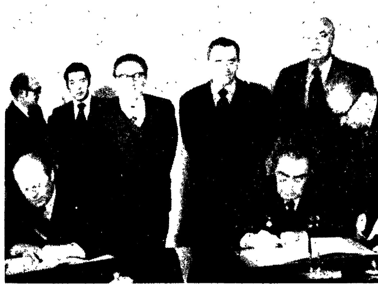
VLADIVOSTOK — Il presidente Gerald Ford e il segretario del PCUS Leonid Breznev firmano la dichiarazione americano-sovietica sulla limitazione degli armamenti strategici...

A una drammatica svolta la dura lotta interna per la trasformazione del Paese