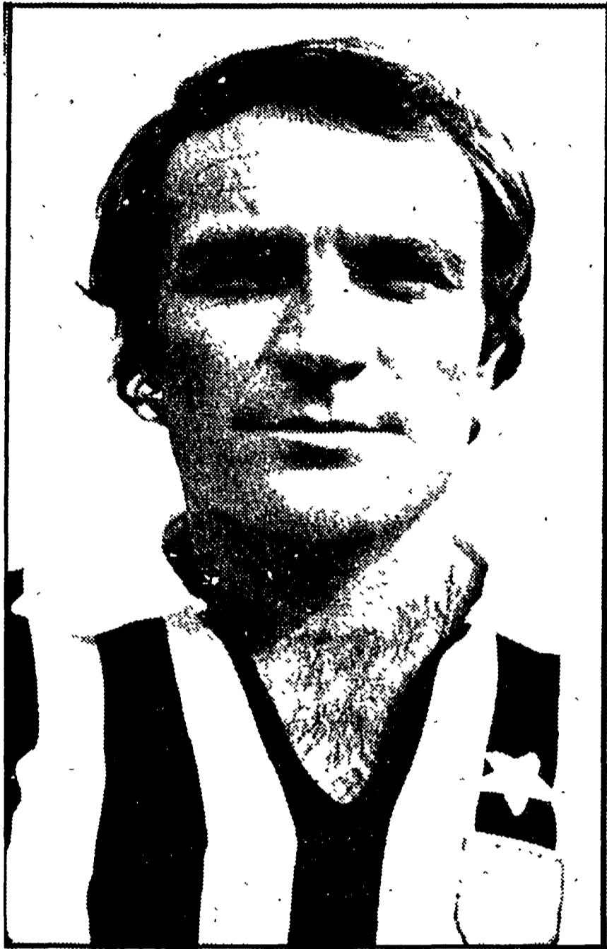
...saranno chiamati ad un severo impegno, rispettivamente,