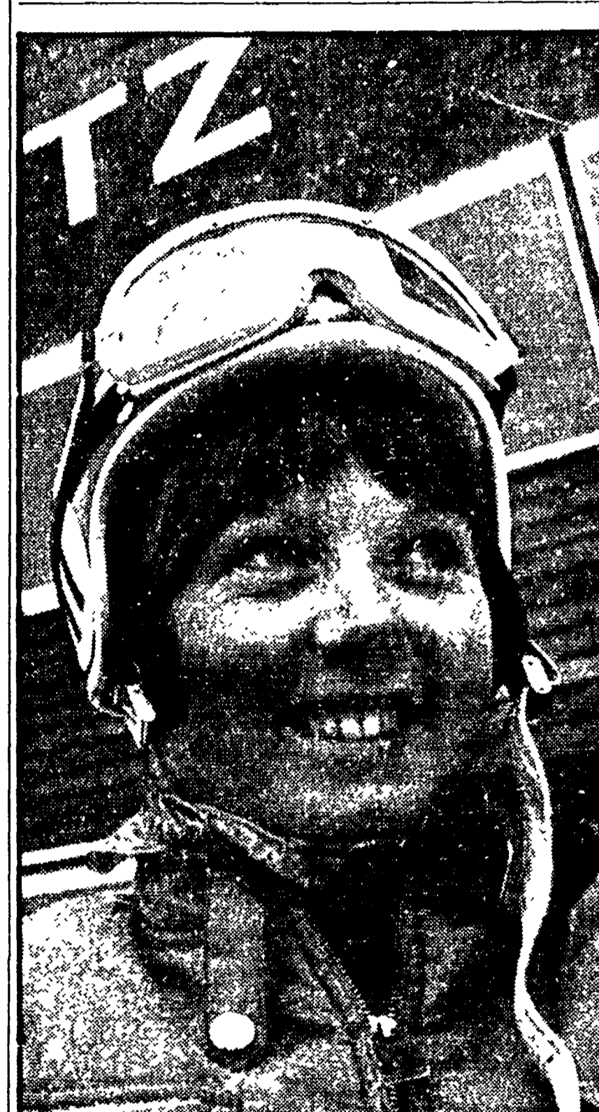
ANNE MARIE PROELL-MOSER ha aggiunto ieri una nuova perla al suo record di vittorie aggiudicandosi lo slalom gigante femminile del criterium « Prima neve » a Val d'Isere