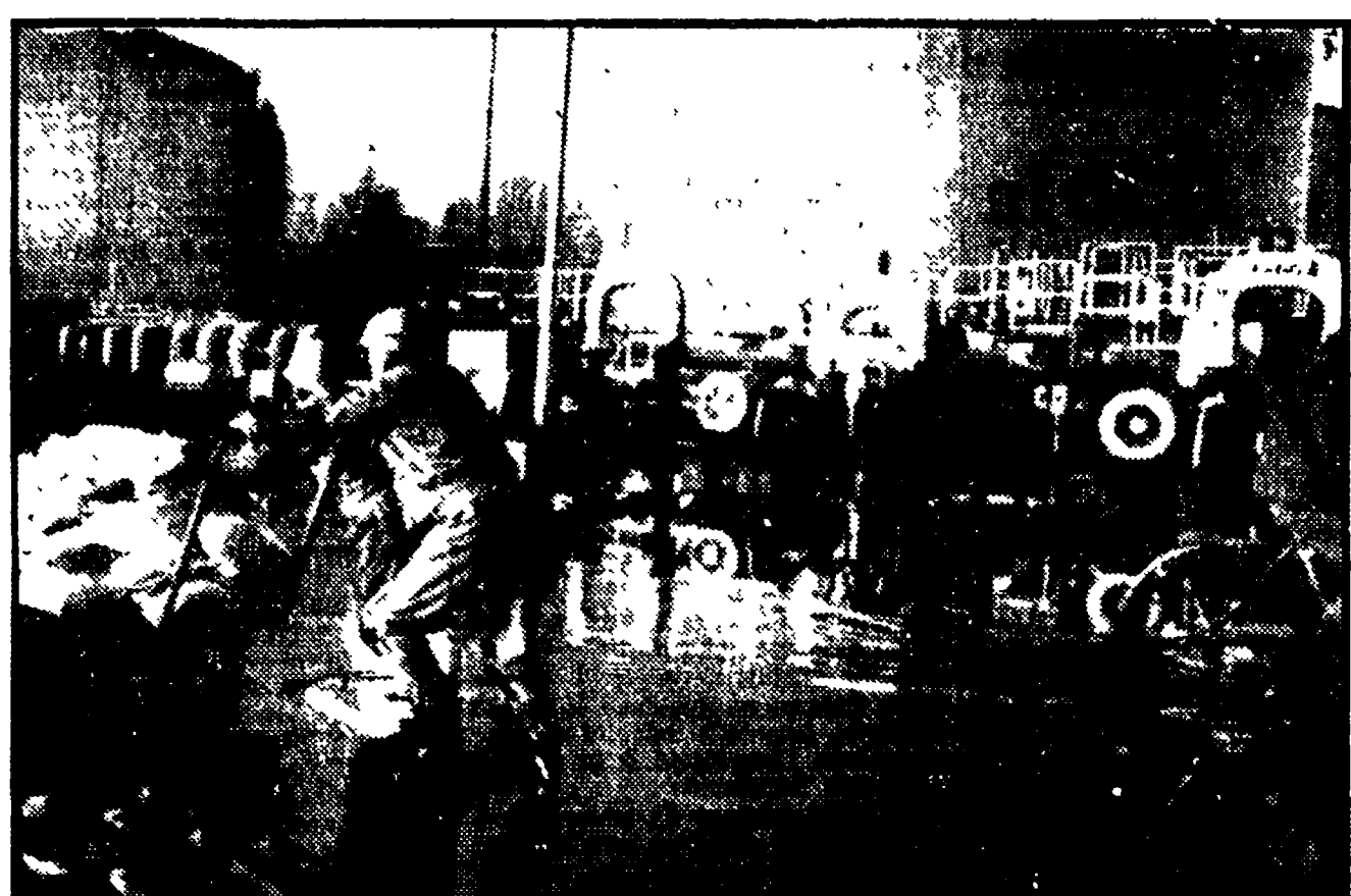
IN LOTTA CONTRO IL PETROLIO. Decine di uomini, con le teste protette da elmetti, al lavoro nel porto giapponese di Kurashiki per innalzare una barriera di sacchetti di sabbia contro il liquido infiammabile, defluito dal deposito di una raffineria in seguito ad un incendio, minacciava di invadere l'intera area portuale, con conseguenze incalcolabili