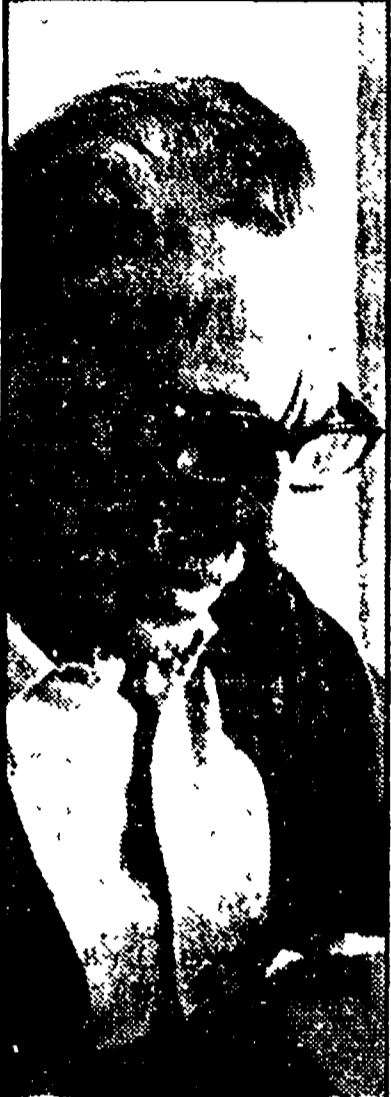
Eduardo De Filippo

«Lu curaggio de nu pumriere napulitano» felicemente riproposta al pubblico dopo cent'anni nella rielaborazione del grande attore, regista e autore