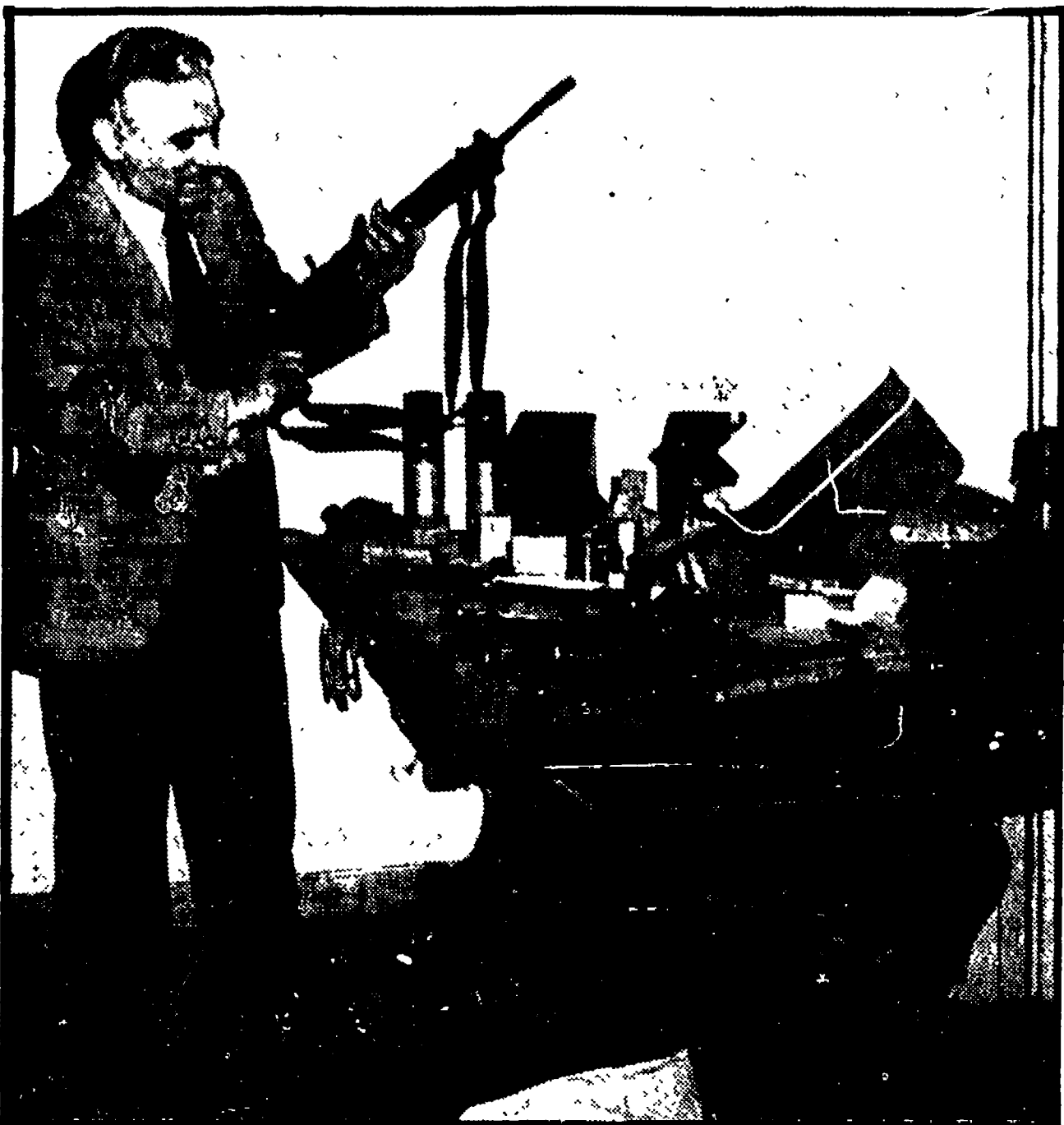
Un funzionario di polizia mostra le armi e il materiale militare sequestrato nella mansarda dei due neofascisti romani

Scoperte attrezzature di guerra, armi ed opuscoli sull'uso degli esplosivi — Il proprietario si è reso tempestivamente irreperibile, insieme ad un suo cugino