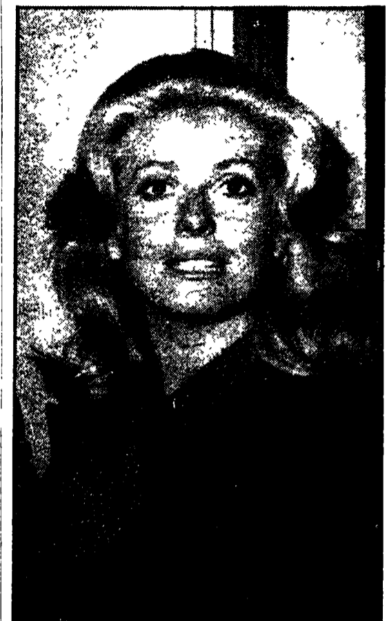
HOLLYWOOD — Catherine Deneuve (nella foto) sta attualmente interpretando negli Stati Uniti il film «Home free»...