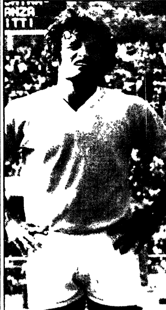
MASSA sarà oggi alla guida dell'attacco del Napoli in sostituzione dello squalificato Clerici