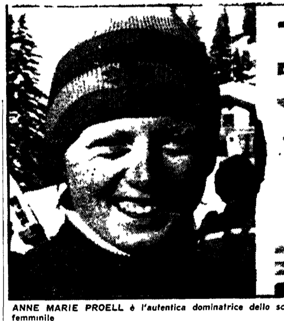
ANNE MARIE PROELL è l'autentica dominatrice dello sci femminile