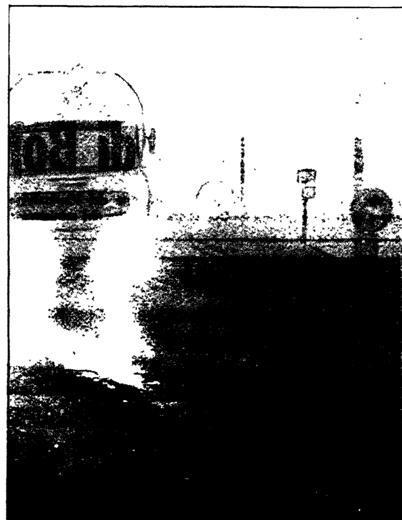
Traffico pericoloso fra la nebbia