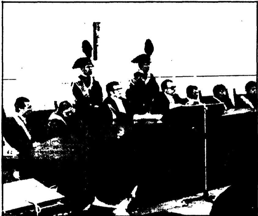
Il presidente e alcuni giurati della Corte di Assise di Catanzaro dove si celebra il processo per la strage di piazza Fontana a Milano

Un'azione logorante in preparazione della richiesta di sospensione del processo e della scarcerazione degli imputati - La difesa del gruppo Valpreda e le parti civili chiedono una sollecita prosecuzione del dibattimento