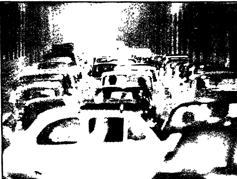
INGORGHIGLI GIGANTESCHI FINO A TARDA SERA. Trullo paralizzato ieri fino a tarda sera in molte zone della città. Sono in questo primo gigantesco ingorgo dell'anno. Alcuni automobilisti hanno abbandonato in strada la loro vettura aspettando che la circolazione tornasse normale. Molte persone che aspettavano l'autobus dopo aver lasciato le loro case a piedi. Gli ingorghi si sono verificati in coincidenza con la partenza dei vigili urbani che ieri (come riferiamo in un altro articolo di cronaca) erano in sciopero assieme a tutti i dipendenti del Comune e il fatto che alla fine del mese molti romani hanno preso l'auto per andare a fare le spese. NELLA FOTO: uno degli ingorghi al Muro Torio

Gli appetiti delle grandi società immobiliari — Urgente il recupero degli spazi necessari ai servizi — Le responsabilità del Campidoglio — Che si aspetta a effettuare la revisione della rete idrica e di quella fognante? — La mozione presentata dal gruppo comunista in Consiglio comunale