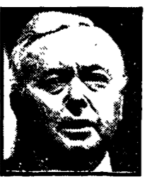
WILSON - Rapporto speciale