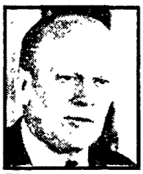
FORD - Ancora la sfida