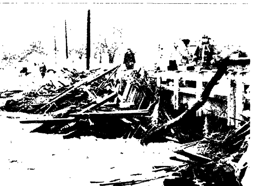
URAGANI SUL TEXAS Forti piogge e violenti uragani hanno colpito in questi giorni il Texas orientale provocando ingenti danni e la morte di almeno due persone nella cittadina di Nacogdoches. NELLA FOTO, i detriti ammassati dalle acque di un torrente in piena contro un ponte.