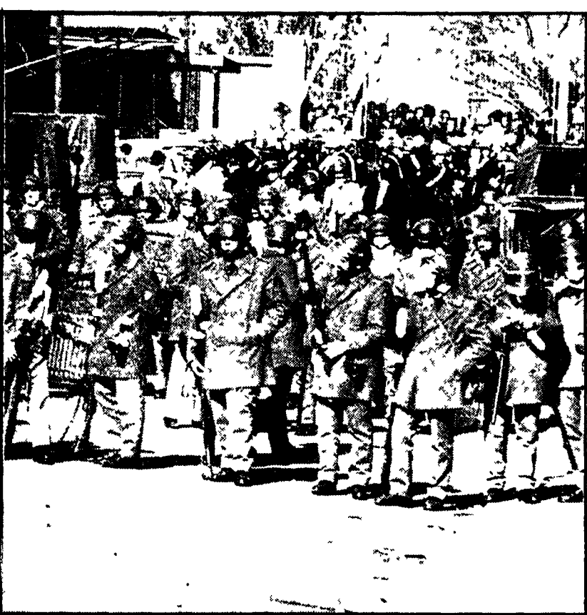
Le elezioni dei delegati studenteschi all'università si dovranno tenere entro i termini previsti, il clima civile e democratico del confronto politico elettorale deve essere rispettato e garantito questo impegno che il Senato accademico ha preso ieri mattina, elevando una ferma condanna dei gravi episodi di violenza provocati dal duro e ingiustificato intervento delle forze di polizia mercoledì scorso. Il Senato accademico ha respinto il suo rinvio.

Le elezioni degli organi collegiali nelle elementari. Oggi ultimo giorno per la campagna elettorale. Appello della Federazione CGIL, CISL, UIL per la partecipazione di tutti i lavoratori e per un'affermazione democratica.