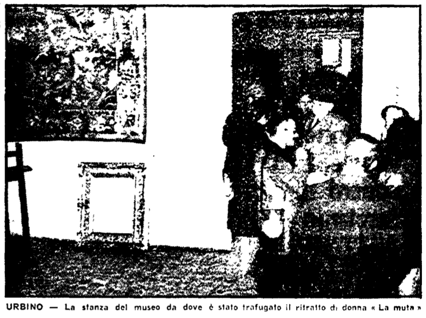
URBINO — La stanza del museo da dove è stato trafugato il ritratto di donna «La muta»