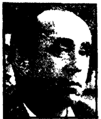
GUERRA — Passare delle parole ai fatti