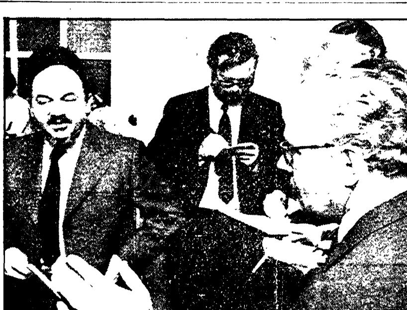
CRISI POLITICA DANESE Il primo ministro danese, Poul Hartung, capo del partito radicale, ha annunciato ieri a Copenhagen (nella foto) che rinuncia a costituire un nuovo governo. Per tanto, la regina Margrethe ha affidato l'incarico ad Anker Jørgensen, capo del Partito socialdemocratico. Ex-primo ministro, Jørgensen dovrebbe formare, a quanto ci si attende, un governo di minoranza costituito soltanto da socialdemocratici.

Sull'andamento dei primi incontri, non è trapezista. Kissinger ha una missione in Israele, che si sa, però, sarà all'ora del pranzo Kissinger avrà partecipato a un pranzo di lavoro durato un paio d'ore assieme al primo ministro Rabin, al ministro della Difesa Moshe Dayan e al ministro della Difesa Peres. Kissinger ha un colloquio a quattro mani di lavoro con il ministro della Difesa Peres. Kissinger si reca oggi al Cairo e da lì si reca a Damasco.