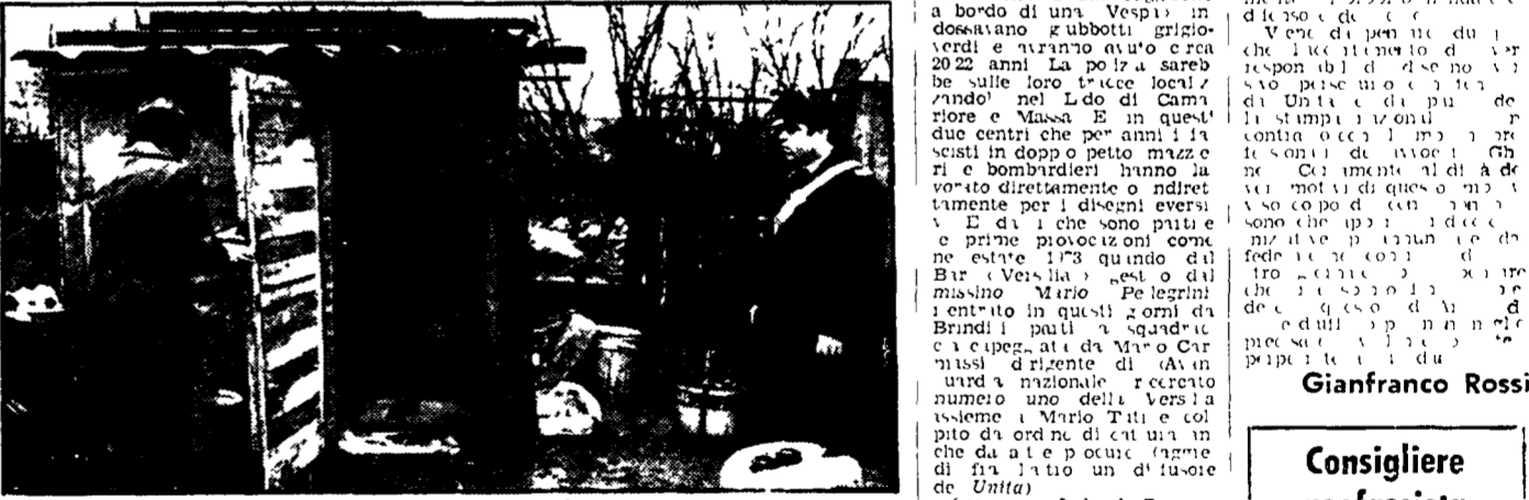
La capanna dove sono stati trovati i corpi dei due giovani

Un colpo di pistola alla testa della ragazza e poi il suicidio. La tragedia è avvenuta in una baracca nei pressi di Milano. La ragazza è stata uccisa e il suo compagno si è suicidato.