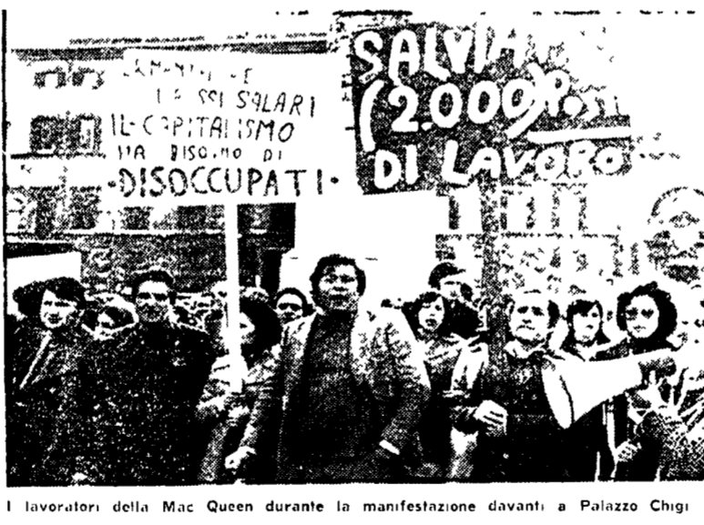
I lavoratori della Mac Queen durante la manifestazione davanti a Palazzo Chigi

RIETI - Il sito è stato inteso per tutto il 1975 al posto di la lotta ad Ariccia per la vertenza di zona sull'occupazione e la difesa dei salari. I lavoratori della Mac Queen hanno manifestato per tre giorni in piazza per impedire la chiusura dell'azienda. Il sito è stato inteso per tutto il 1975 al posto di la lotta ad Ariccia per la vertenza di zona sull'occupazione e la difesa dei salari. I lavoratori della Mac Queen hanno manifestato per tre giorni in piazza per impedire la chiusura dell'azienda.