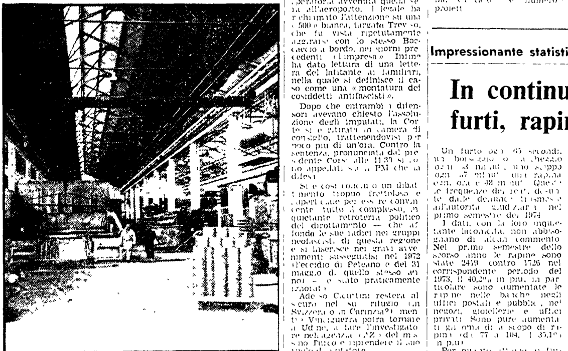
Un reparto delle Fibronit

La sentenza per la sanguinosa impresa a Ronchi dei Legionari. Il condannato è un ex segretario locale del MSI che fuggì subito dopo il colpo fallito.