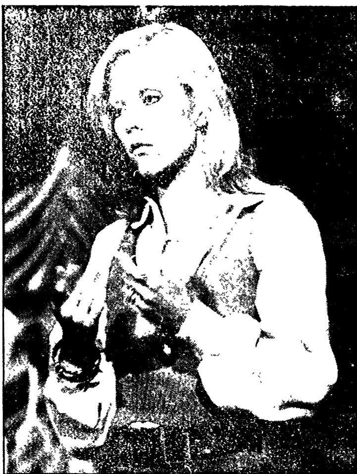
La cantante francese Sylvie Varlan (nella foto) sarà accanto a Gino Bramieri nel teleshow «Punto e basta», diretto da Eros Macchi. Era dai tempi di «Zam Zum Zam» che la Varlan mancava dai nostri teleschermi. Meno male che è tornata: ci voleva una «graziosa presenza» in una varietà televisiva