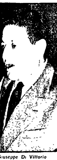
Giuseppe Di Vittorio