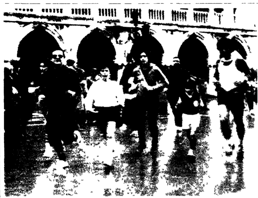
MARZIA POPOLARE SUI PONTI DI VENEZIA

DALLA REDAZIONE TORINO, 9 marzo. « Trent'anni di pace. Pace di morti. Ma i morti alzano la mano. Il loro spagnolo è ritornato e la sua arena è tutta la Spagna... »