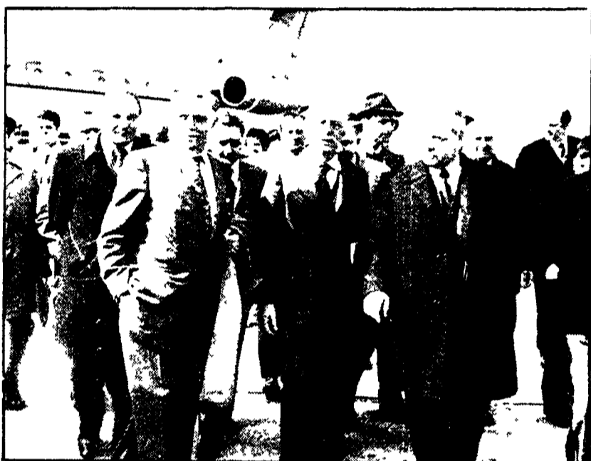
Giunte ieri numerose delegazioni estere

Il Congresso si apre alle 9 in punto nella grande arena del Palazzo dello sport, all'EUR, presenti gli oltre mille delegati eletti nei congressi federali, le delegazioni dei partiti italiani ed esteri, migliaia di invitati, centinaia di giornalisti di tutto il mondo.