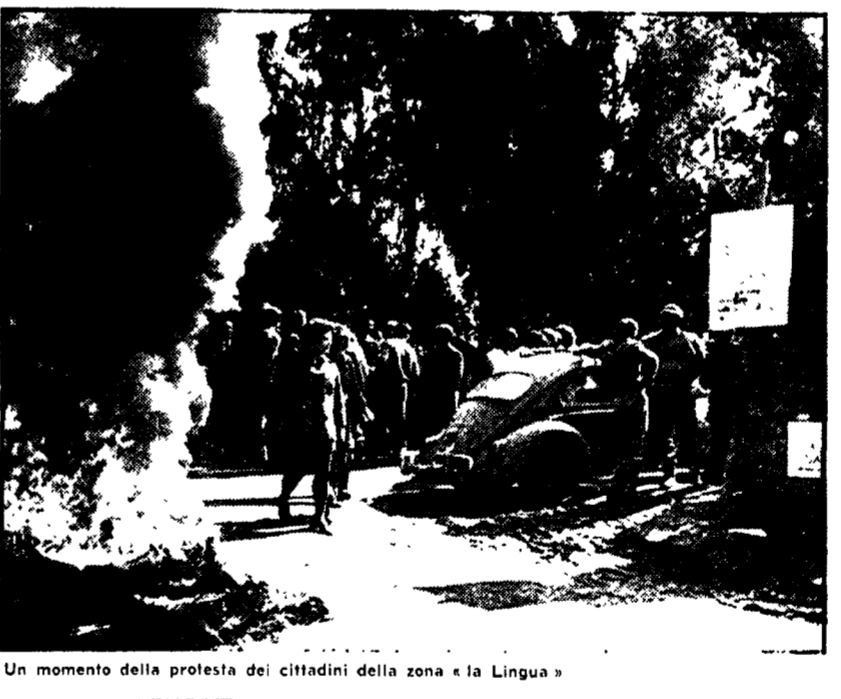
Un momento della protesta dei cittadini della zona «La Lingua»

I proprietari hanno impedito l'operazione di abbattimento delle costruzioni - Momenti di tensione