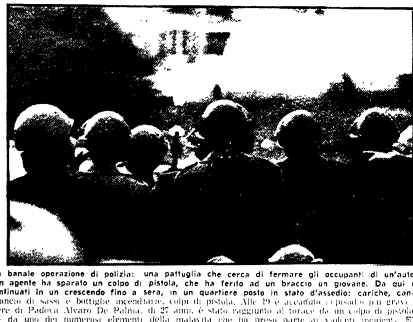
una pattuglia che cerca di fermare gli occupanti di un'auto pistola, che ha ferito ad un braccio un giovane. Da qui i serà, in un quartiere posto in stato d'assedio: cariche, cannonate, colpi di pistola. Alle 19 è scattato l'episodio più grave, quello del colpo di pistola al torace da un colpo di pistola parte ai violenti incidenti. E' ricoverato al Policlinico Ge...

Dopo l'incalzante iniziativa dei comunisti e del movimento unitario